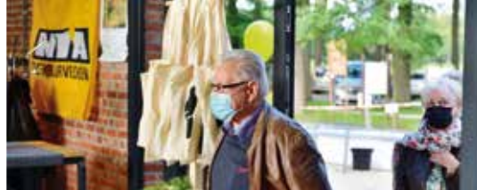
Onze N-VA-afdeling blaast tien kaarsjes uit! (p.3)