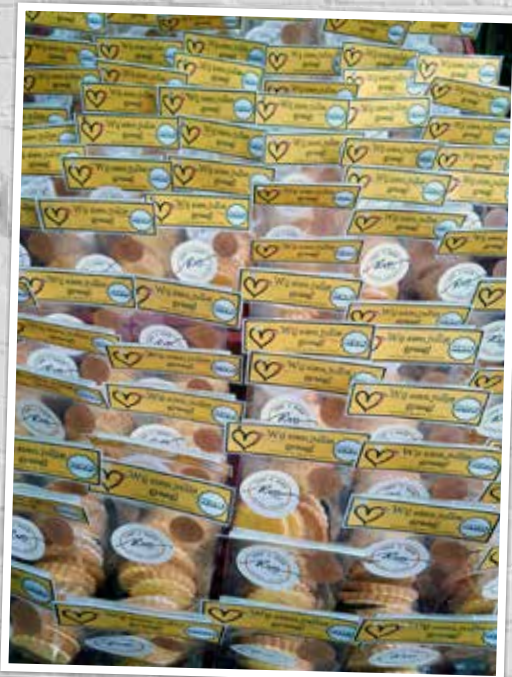
▲ In de valentijnsperiode verdeelden we vers gemaakte koekjes, gemaakt door een lokale bakker, aan onze leden. Lekker!

In maart was het tien jaar geleden dat de N-VA in Rijkevorsel officieel van start ging. We hadden plannen om van 2021 een feestjaar te maken, maar door het ondertussen gekende virus moesten we jammer genoeg een tandje terug schakelen.