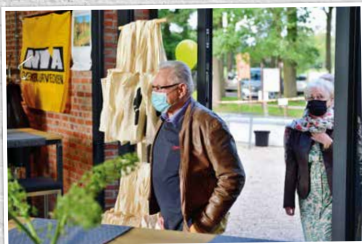
▲ Eind augustus was er de apotheose met een groot feest voor onze leden en genodigden met een heerlijke barbecue en de nodige drankjes.