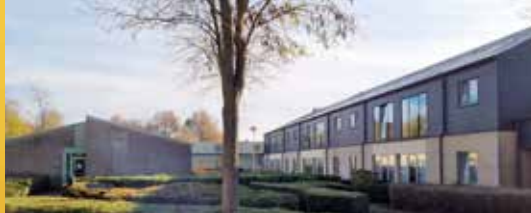
Masterplan woonzorgcentrum (p.2)