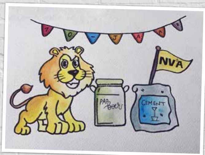
▲ De mascotte voor ons feestjaar.